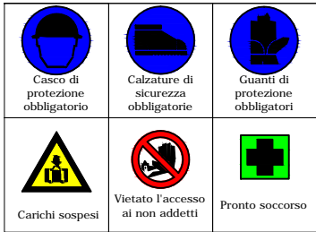
Principale segnaletica di cantiere